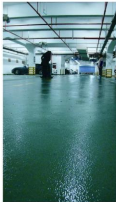
(昆山裕元花园酒店地下车库)