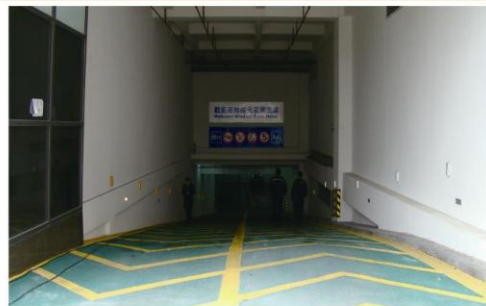
(昆山裕元花园酒店地下车库入口)

停车坪、码头、停车场、桥梁、仓库、冷冻库、市场、堆高机之走道、厨房、机场跑道、溜冰场、水坝工程、重机油厂房、电子厂、发电厂、电机厂、化工厂之止滑地坪。