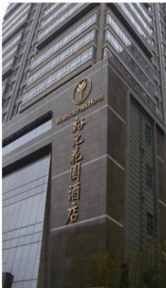
(昆山裕元花园酒店磐石漆)

磐石漆是南宝树脂(中国)有限公司的产品，它满足了现今环保节能的建筑外墙涂装市场，使得建筑师、房产商和工程师能够出色的完成颜色、建筑外观、造型的设计及节能系统的施工，磐石漆的仿真程度高达100%，在提供丰富的创造性同时，还具有无与伦比的功能优势，从而激发建筑设计师创造个性和与众不同的外墙质感潜能，将色彩和个性融入建筑外墙的功能和造型，这是外墙涂料以前不可想象的杰作。