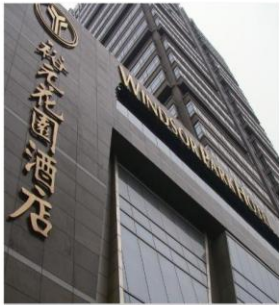
(昆山裕元花园酒店)